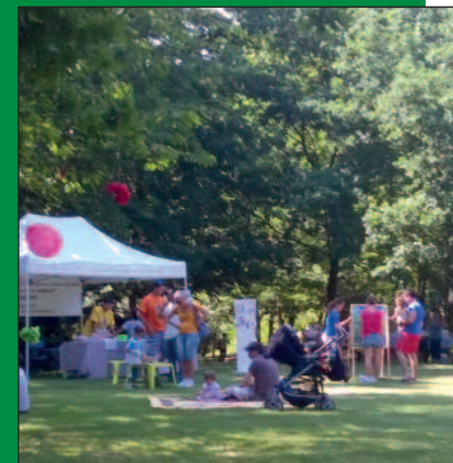
La "Festa delle famiglie" 2017