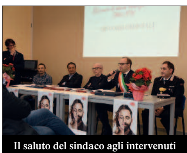
Il saluto del sindaco agli intervenuti