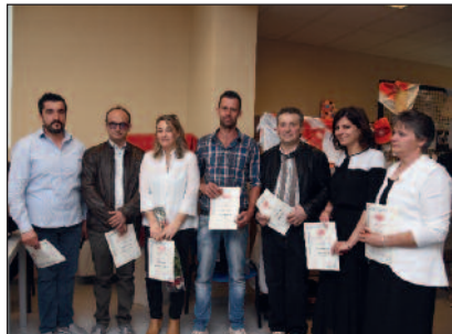
Il folto gruppo dei premiati con la prima medaglia d'oro

familiari come una tradizione naturale, necessaria, doverosa e bella. Storie come questa hanno però continuamente bisogno di nuovi protagonisti, devono continuare ad arricchirsi di nomi, volti, sorrisi, speranze, gesti, fatica, lavoro, servizio. Ed è l'augurio e l'invito che il presidente e i responsabili del Gruppo Fidas di San Giuseppe hanno fatto perché una storia lunga 50 anni continui ancora per tanti altri anni ad illuminare il futuro di migliaia di persone