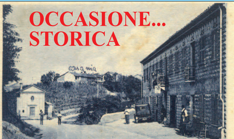
Quando ai "Chinoni" c'erano una "stazione" di auto e l'albergo di Giovanni Mo

L'idea di pubblicare un libro fotografico, nata dalla mostra En tesor en pais , su panorami, persone, personaggi, momenti di vita di Sommariva Perno sta prendendo corpo, perché parecchi sommarivesi hanno risposto all'appello lanciato su Il Perno di