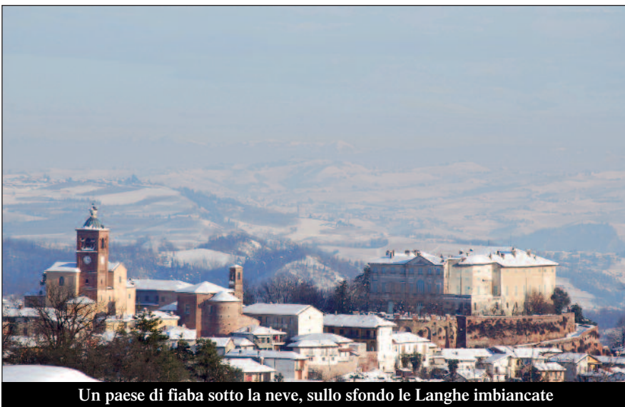
Un paese di fiaba sotto la neve, sullo sfondo le Langhe imbiancate

deve essere svolto in modo autonomo, dandone informazione al Comune entro la mattinata successiva. Tutto questo la Ditta lo ha fatto regolarmente e con piena soddisfazione dell'Amministrazione. C'è però sempre qualche cittadino che si lamenta perché il passaggio delle macchine operatrici ha lasciato magari un po' di accumulo sul fronte strada delle proprietà private e sui marciapiedi. Questo "inconveniente" non potrà mai essere eliminato: il buon senso dice però che se ognuno pulisce qualche metro quadrato di accesso davanti a casa tutto si risolve. Altri invece pretendono la pulizia fin sul cortile, dimenticando magari che il