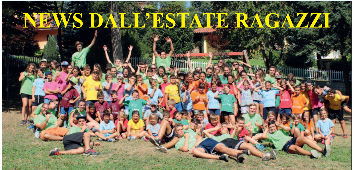
Il gruppo di ragazzi e animatori al termine di "Estate ragazzi 2017"

Quattro settimane di "Estate-ragazzi", una in più rispetto al solito! E' il regalo che il Gruppo Volontari di Sommariva Perno, in collaborazione con la cooperativa Lunetica di Bra, il Comune e la Parrocchia, farà quest'anno ai bambini e ai ragazzi di Sommariva Perno. A partire, dunque, da lunedì 2 e fino a venerdì 27 luglio gli alunni dalla prima elementare completata alla 2^ media, tutti i giorni dalle 8.30 alle 17.30 potranno vivere insieme momenti di gioco, di allegria, di impegno scolastico.