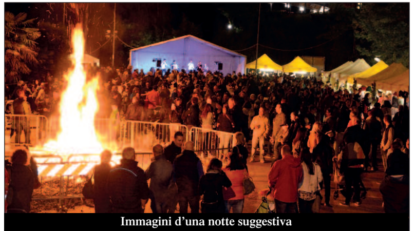
Immagini d'una notte suggestiva

E' stata una festa riuscita. Canti, balli, colori, profumi hanno riempito di allegria la frazione di San Giuseppe nella "tre giorni" del Pianté magg 2018. Un mare di gente ha salutato, lunedì 30 aprile, i fuochi e il rito magico e propiziatorio dell'innalzamento del pino, che per un mese sverterà su piazza Zio John, come segno di buon auspicio per un anno che ci si augura sereno.