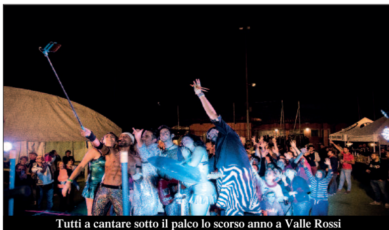
Tutti a cantare sotto il palco lo scorso anno a Valle Rossi