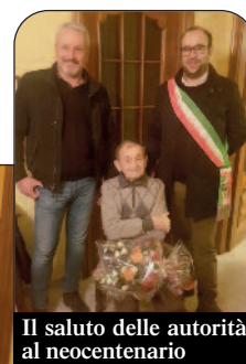
Il saluto delle autorità al neocentenario